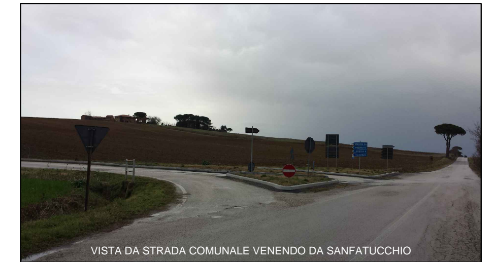
VISTA DA STRADA COMUNALE VENENDO DA SANFATUCCHIO