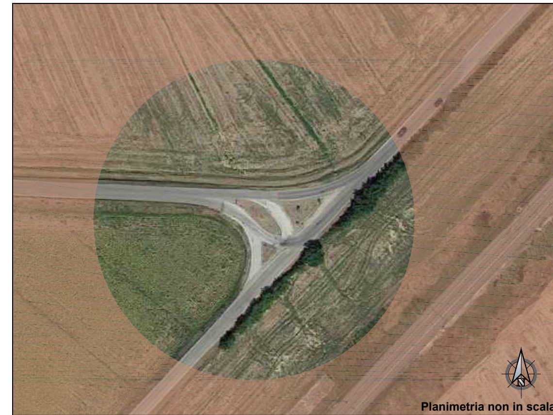
Planimetria non in scala