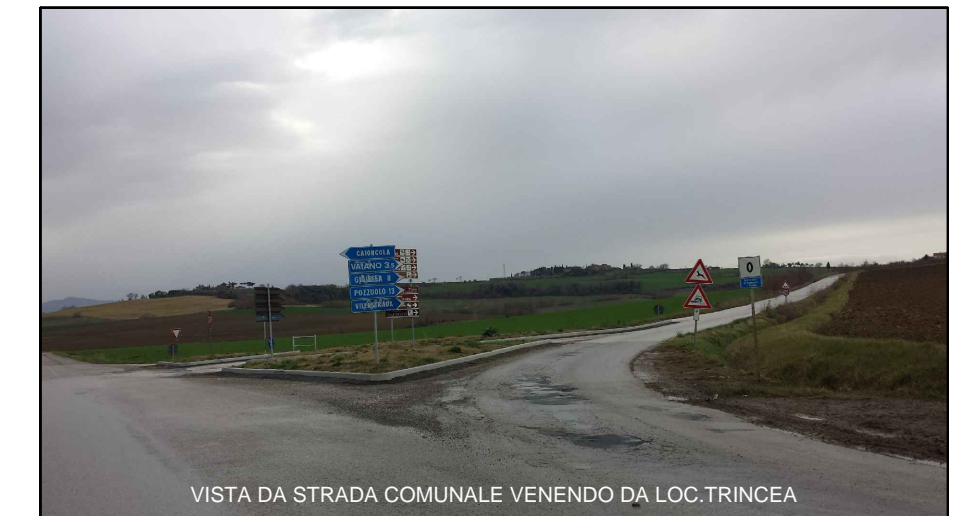
VISTA DA STRADA COMUNALE VENENDO DA LOC.TRINCEA