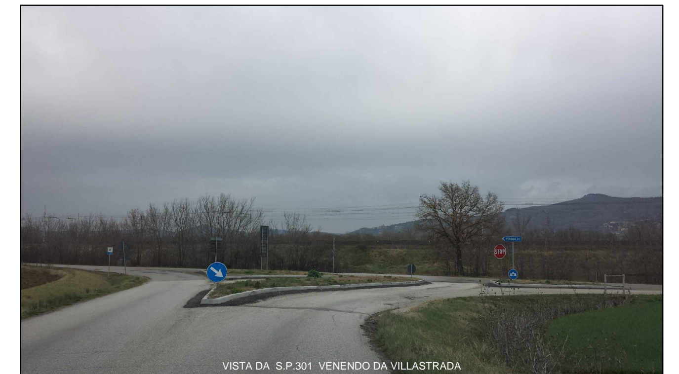
VISTA DA S.P.301 VENENDO DA VILLASTRADA