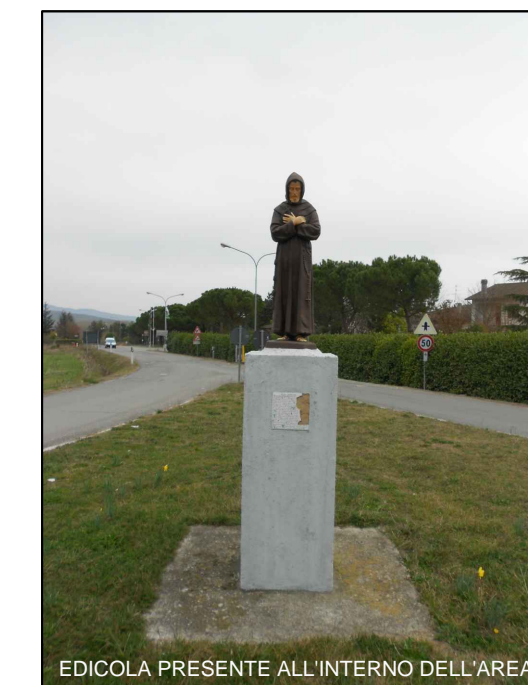
EDICOLA PRESENTE ALL'INTERNO DELL'AREA