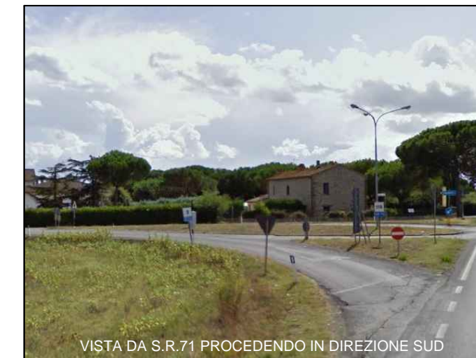
VISTA DA S.R.71 PROCEDENDO IN DIREZIONE SUD