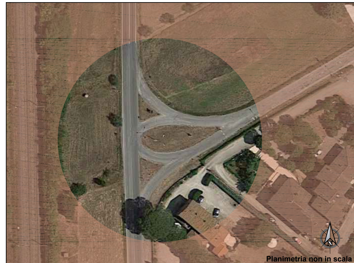
Planimetria non in scala