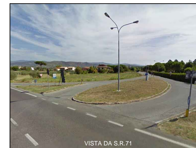
VISTA DA S.R.71