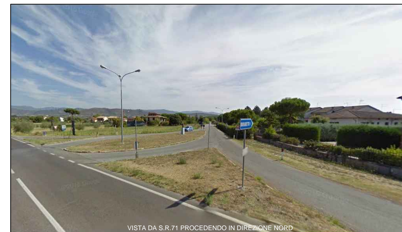
VISTA DA S.R.71 PROCEDENDO IN DIREZIONE NORD