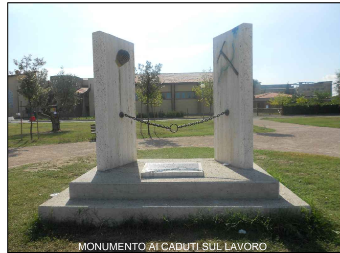
MONUMENTO AI CADUTI SUL LAVORO