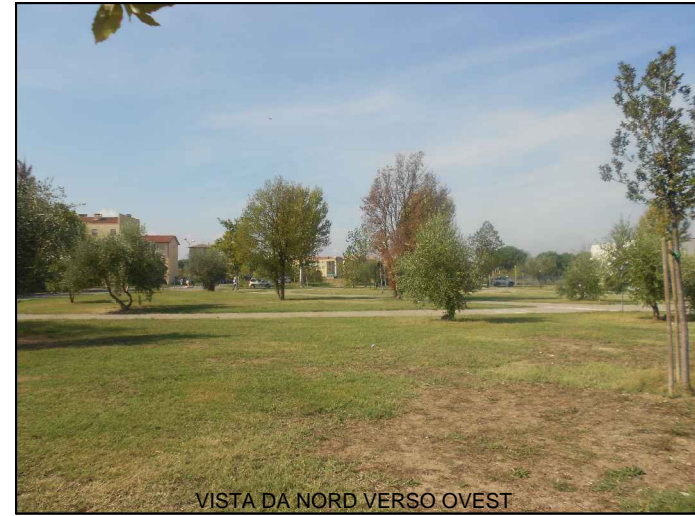
VISTA DA NORD VERSO OVEST