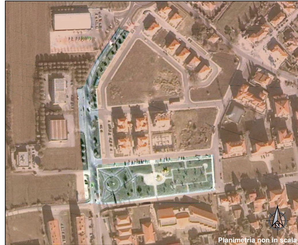
Planimetria non in scala