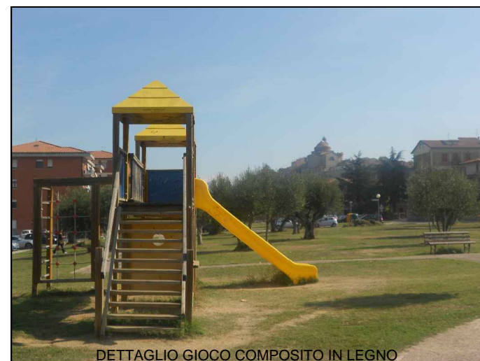
DETTAGLIO GIOCO COMPOSITO IN LEGNO