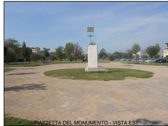
PIAZZETTA DEL MONUMENTO - VISTA EST