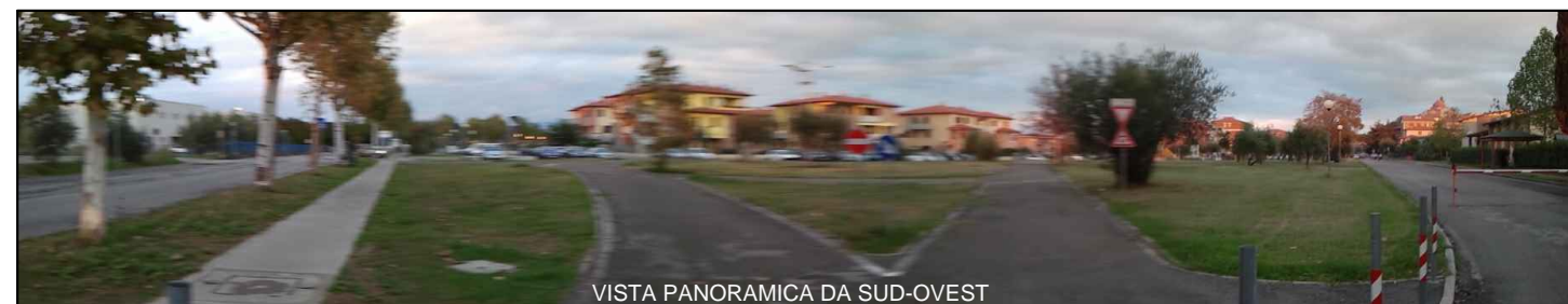
VISTA PANORAMICA DA SUD-OVEST