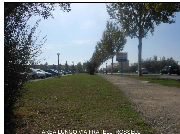
AREA LUNGO VIA FRATELLI ROSSELLI