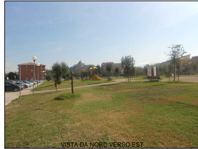
VISTA DA NORD VERSO EST