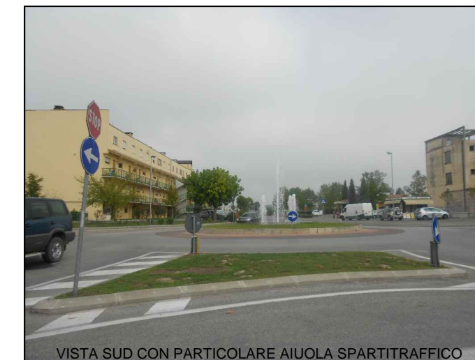
VISTA SUD CON PARTICOLARE AIUOLA SPARTITRAFFICO