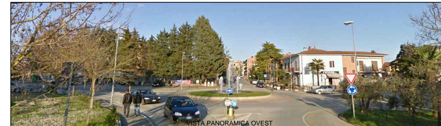
VISTA PANORAMICA OVEST