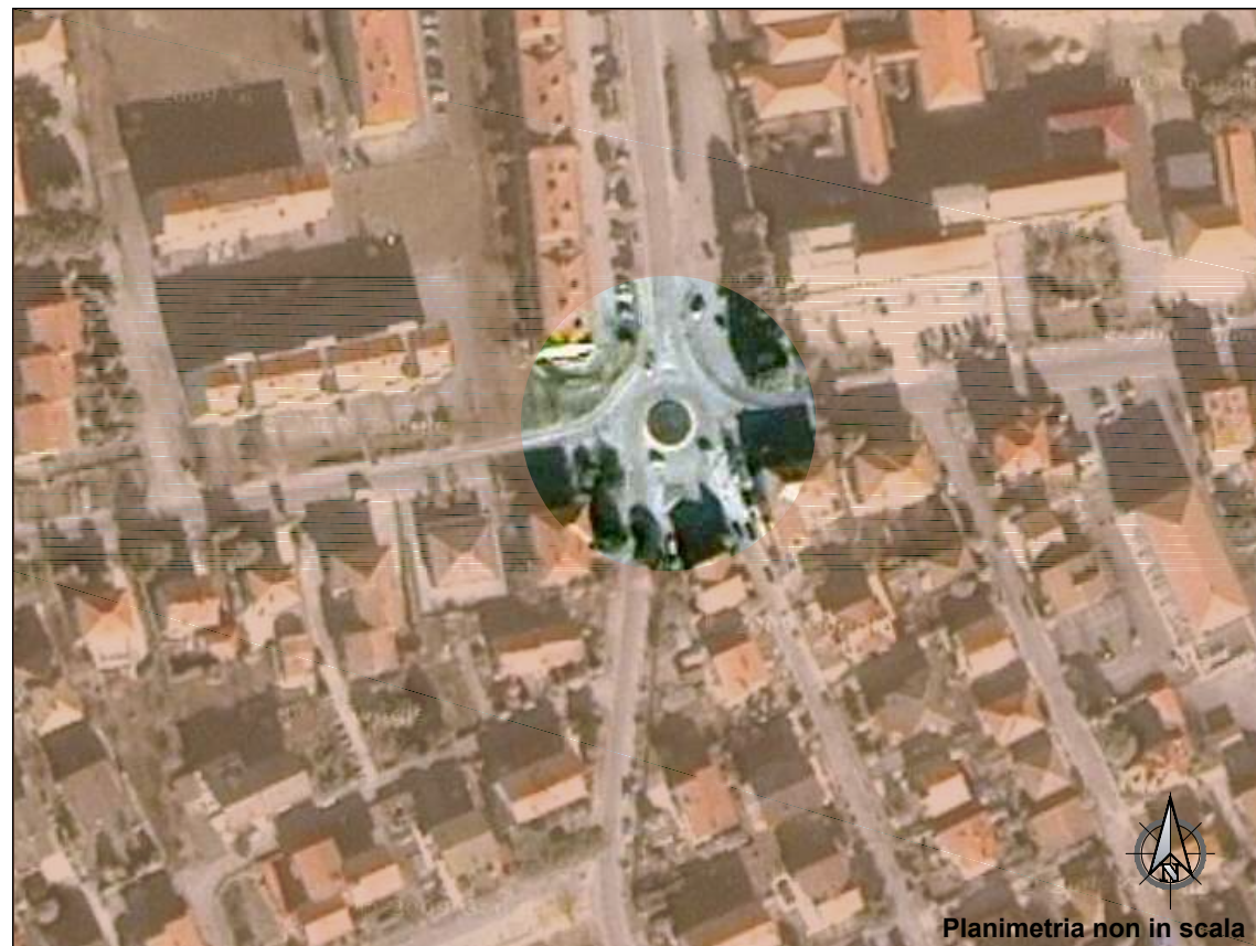
Planimetria non in scala