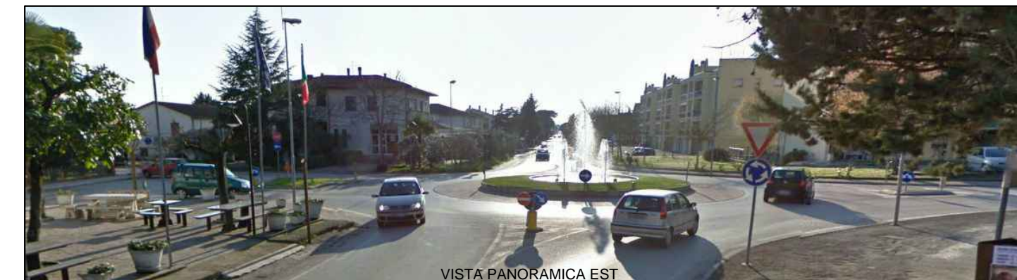
VISTA PANORAMICA EST