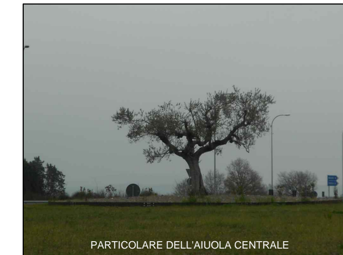
PARTICOLARE DELL'AIUOLA CENTRALE