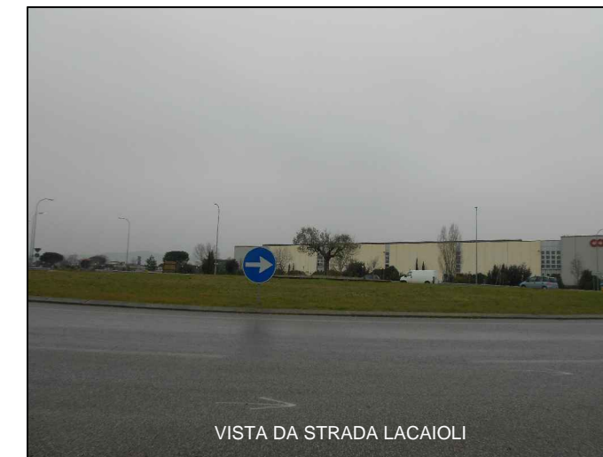
VISTA DA STRADA LACAIOLI