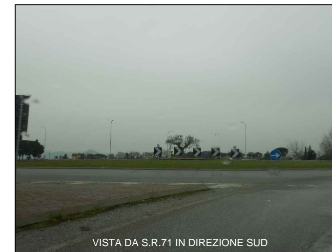
VISTA DA S.R.71 IN DIREZIONE SUD