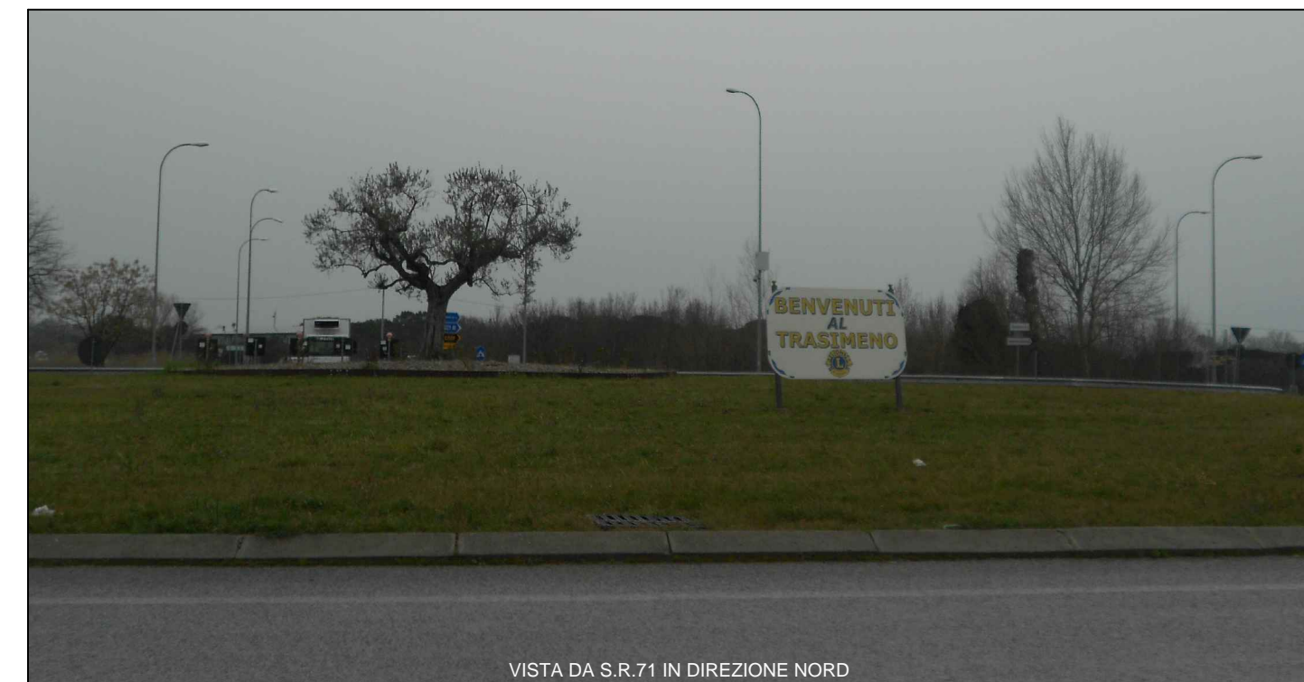
VISTA DA S.R.71 IN DIREZIONE NORD