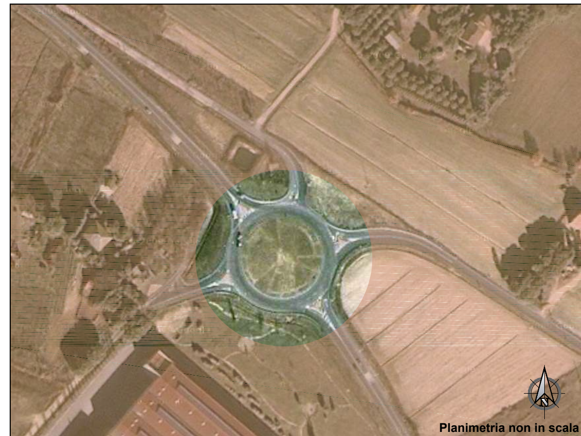
Planimetria non in scala