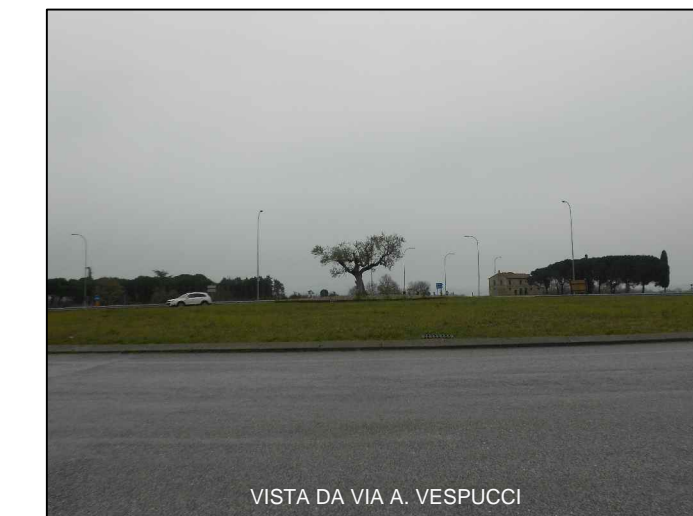
VISTA DA VIA A. VESPUCCI