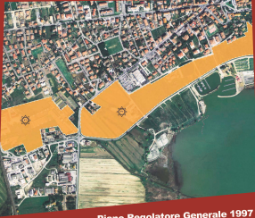
Piano Regolatore Generale 1997