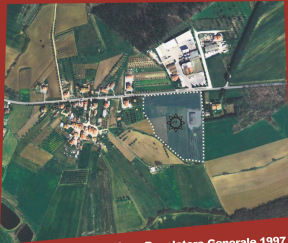
Piano Regolatore Generale 1997