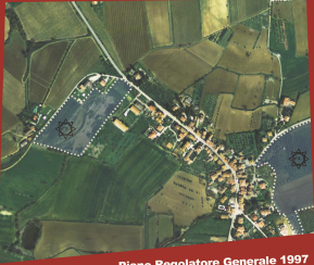
Piano Regolatore Generale 1997