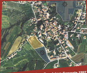
Piano Regolatore Generale 1997