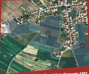
Piano Regolatore Generale 1997