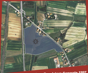
Piano Regolatore Generale 1997