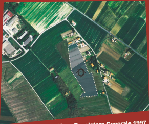
Piano Regolatore Generale 1997