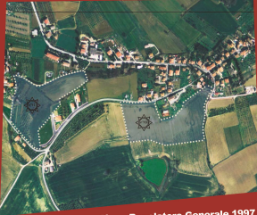
Piano Regolatore Generale 1997