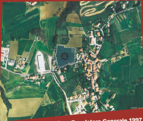
Piano Regolatore Generale 1997