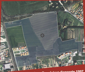
Piano Regolatore Generale 1997