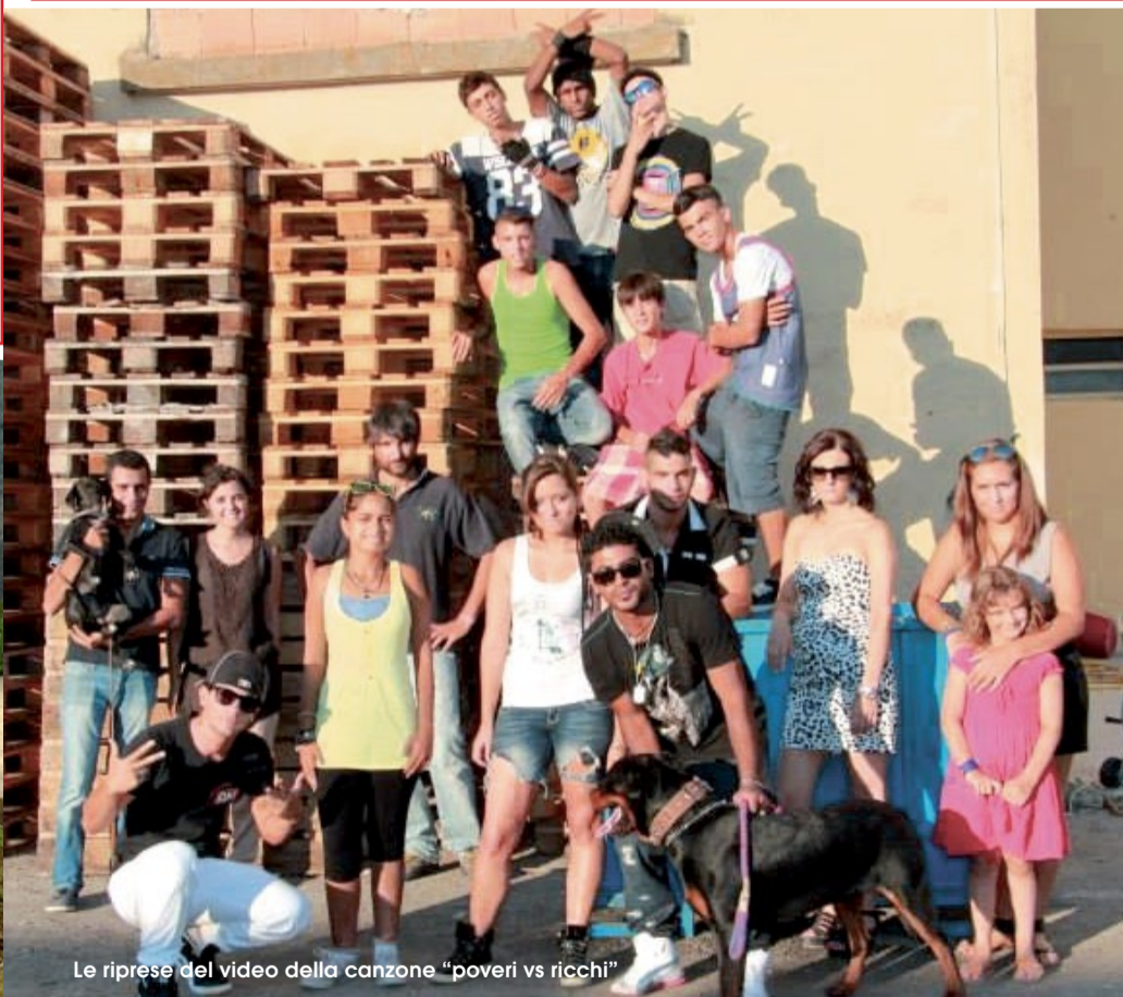
Le riprese del video della canzone "poveri vs ricchi"

Associazione. Chi non conosce questa parola? Penso che tutti voi lettori la conoscete, ma non sapete cosa vuol dire viverci dentro. Secondo il mio parere possiamo considerare l'associazione come un organismo vero e proprio che vive grazie ai gesti delle persone che lo costituiscono, ma le persone che la costituiscono devono vivere in simbiosi per ottenere dei risultati. Ogni idea, ogni azione, ogni problema risolto possono aiutare a migliorarci e di conseguenza a migliorare la nostra associazione. Quindi si può dire che da qualsiasi esperienza che si vive, ne esce sempre un fatto po-