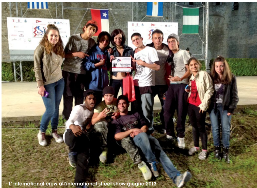
L' international crew all'international street show giugno 2013

Sono entrata nell'associazione i ragazzi fanno oh! grazie ad un amico e posso dire che mi ha incuriosita, infatti mi ha fatto conoscere nuove prospettive di vita.