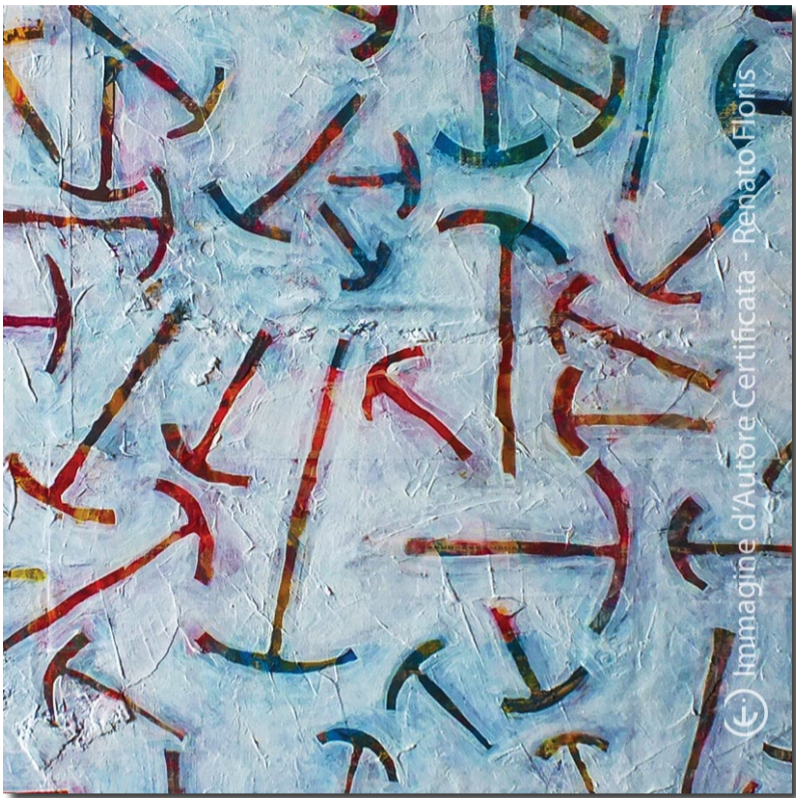
Immagine d'Autore Certificata - Renato Floris