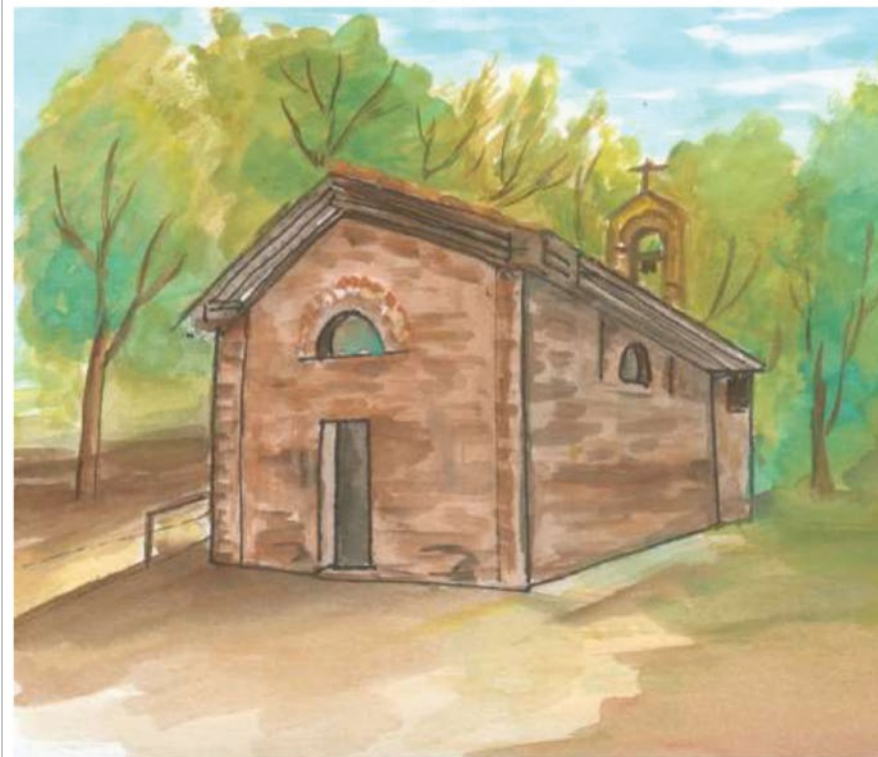
CORTONAGRAFICA - CORTONA