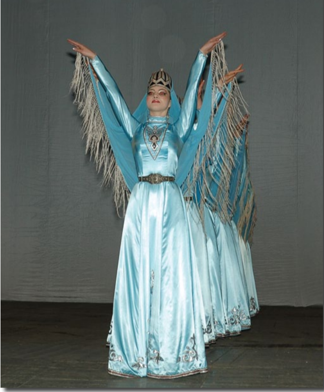
L'Ensemble "Goretz" di Vladikavkaz (Ossezia del Nord, Russia)