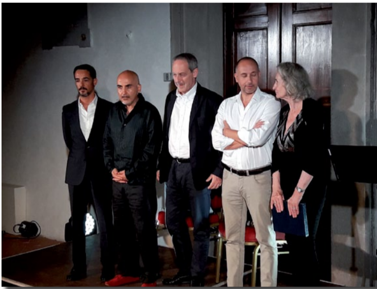
Un momento del Premio "Ars Contemporanea"