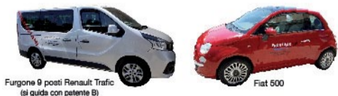
Furgone 9 posti Renault Trafic (si guida con patente B)

via Roma 180 Castiglione del Lago (PG) tel. 075 965 2815 - cell. 348 473 0400 autosalonepronticar@libero.it