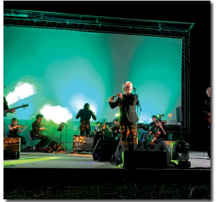
I New Trolls insieme alla Scuola di Musica del Trasimeno durante il "Concerto Grosso" del 13 agosto

Ma la vera novità di quest'anno è stata quella di domenica 13 agosto, serata che si è svolta presso il teatro la Rocca che ha visto l'orchestra della scuola di musica del Trasimeno affiancare Vittorio De Scalzi, componente del famoso gruppo degli anni '70 dei New Trolls, eseguire con la band uno dei pezzi più famosi ed unici di opera rock "Concerto Grosso" scritto dal grande compositore Luis Enriquez Bacalov, vincitore nel 1995 del premio Oscar per la composizione della colonna sonora del film "Il Postino". L'insediamento all'interno del Festival di una serata come questa che ha visto protagonisti l'orchestra della nostra Scuola di Musica nell'esecuzione di un pezzo cavallotto di battaglia di uno dei gruppi più famosi degli anni '70 quali i New Trolls, è stata un successo assoluto, di pubblico e di gradimento, del Festival di quest'anno che ha voluto allargare i suoi spazi musicali e dimostrare che